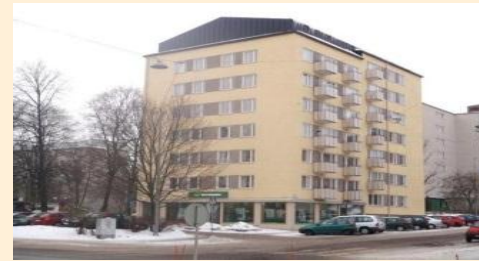
Tuettu asuminen asunnot eri puolilla Turkua