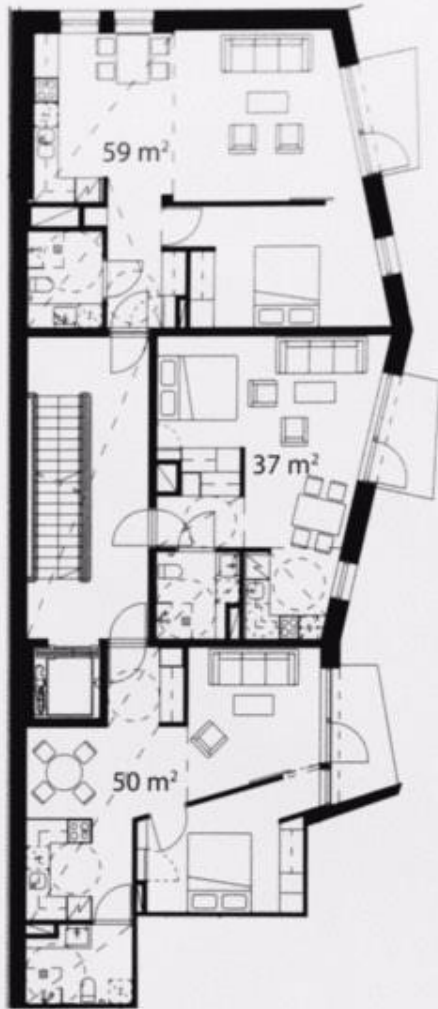
2. kerros | 1st floor 1:250